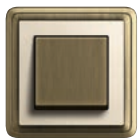
A Bronze- Cremeweiß