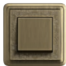
A Art Bronze