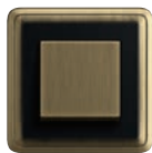
A Bronze- Schwarz