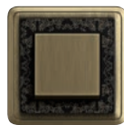
A Art Bronze- Schwarz