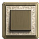
A Art Bronze- Cremeweiß